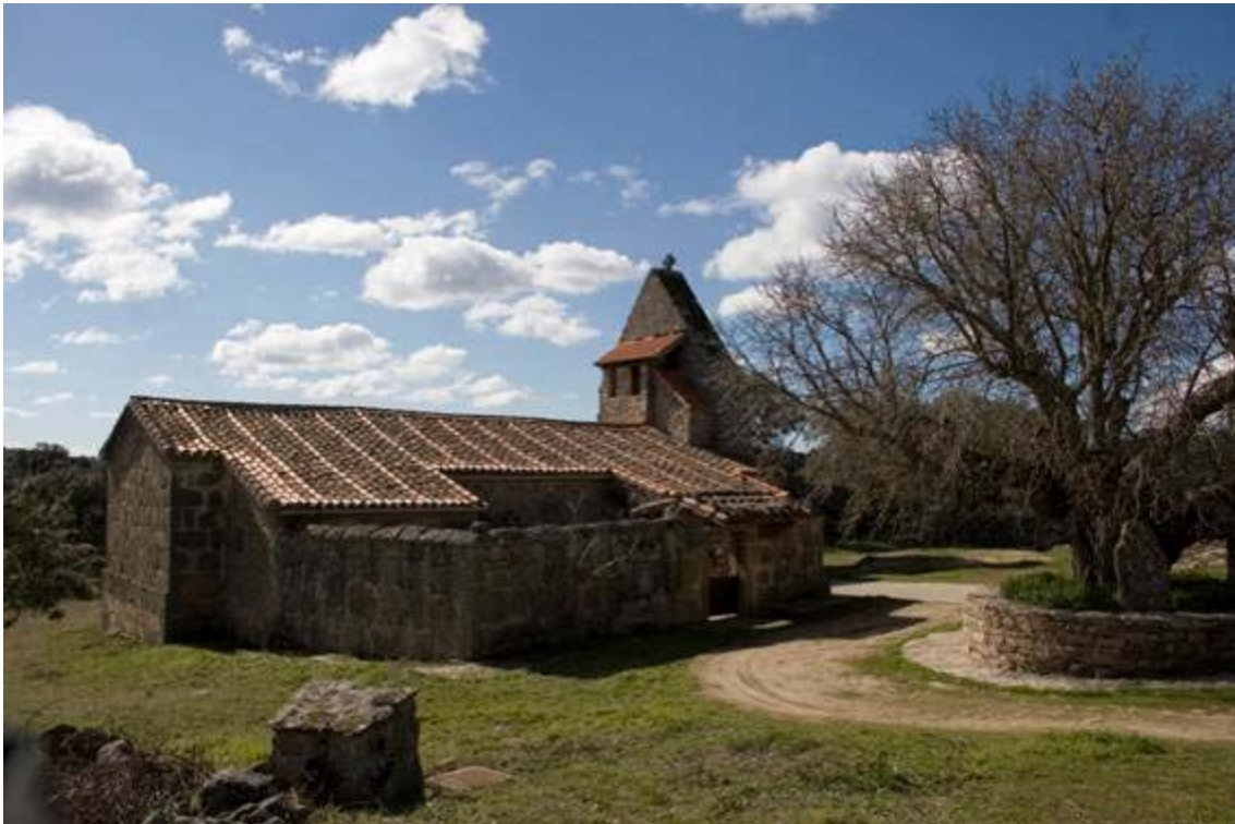
Exterior de la iglesia de Sta. María Magdalena. Cozcurrita Zamora