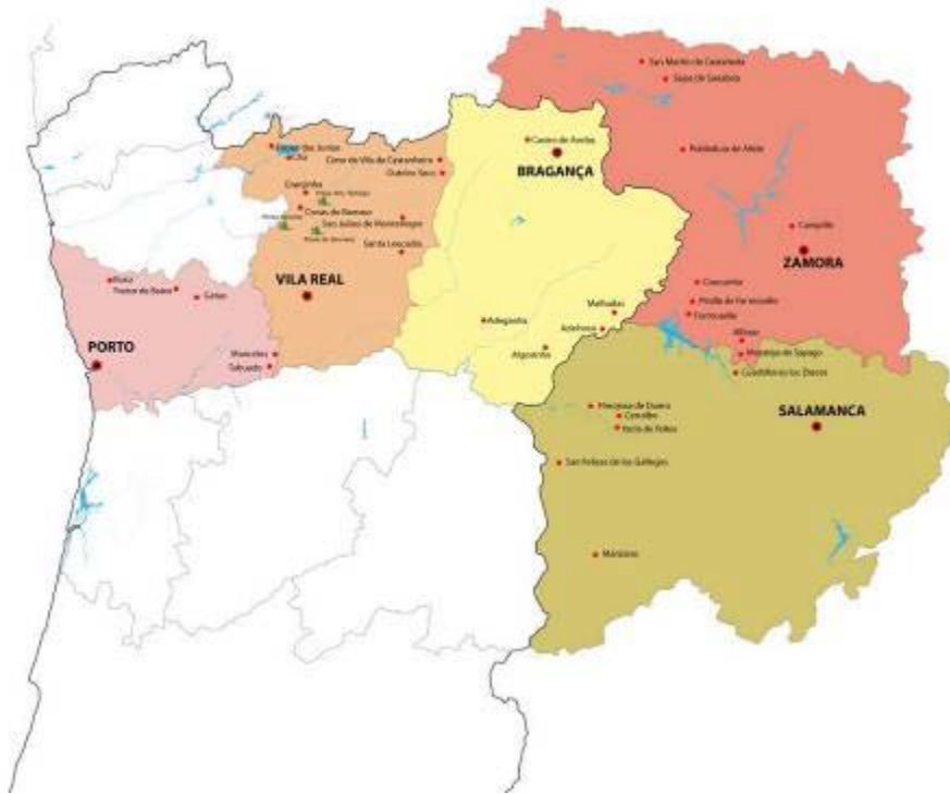
Mapa del territorio de Románico Atlántico