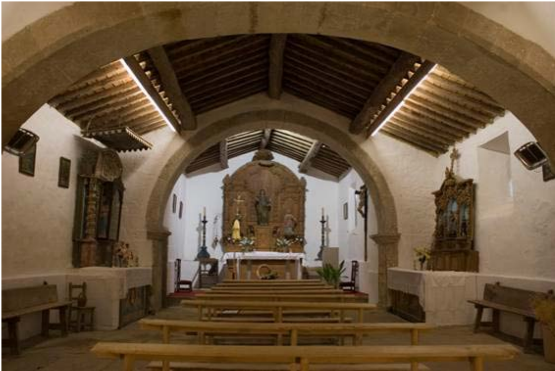
Interior del templo.

clara filiación románica, se localiza en una posición inusual: en el extremo occidental del muro norte. La espadaña, sobre el hastial, es tipológicamente románica, aunque parece que fue rehecha en otra época, difícil de precisar. El interior del templo ha sido ampliamente reformado en distintas épocas, siendo en todo caso la humildad constructiva la nota característica.